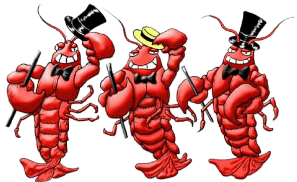
Abb. IV: Infizierte ( Influenza homaris )

Chlouseweekend, doch davon will ich lieber noch nicht zu viel ver-