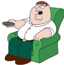
Abb. I: normaler Mensch

So, langsam aber sicher gehts dem Hummerkönig an den Kragen! Auch wenn wir bisher noch nicht in direkten Kontakt mit den Armeen des Hummerkönigs gekommen sind, wird die Gefahr doch immer grösser. Man liest von immer mehr Fällen in der Zeitung oder im Internet, wo normale Menschen (Abb. I) von der Hummerpandemie angesteckt werden. Die Bevölkerung versucht sich durch einfache Massnahmen, wie Impfungen oder Schutzmasken (Abb. II) zu schützen, was jedoch nach wissenschaftlichen Meinungen absolut gar nichts bringt.