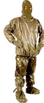
Abb. II: Schutzmaske

Leider wurde noch immer kein Heilmittel gefunden, die einzige Möglichkeit, die die Bevölkerung hat, ist Wegrennen, wenn sie ein ihnen suspekt erscheinendes, Hummerähnliches Objekt erblicken. Die Bevölkerung wird gebeten, bei Sichtung eines oben beschriebenen Subjekts nicht gewalttätig zu werden. Der gemeine, ansteckende Armeehummer und die hummerähnlichen Infizierten sehen sich auf den ersten Blick äusserst ähnlich (Abb. III und IV)